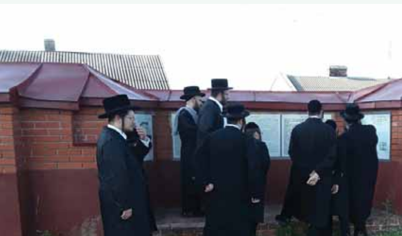
מאת: ה. שמשון

חסידים ואנשי מעשה מלונדון בראשונת נכדי כ"ק האדמו"ר מטריסק לונדון זצ"ל עלו לפקוד את ציונו באוקראינה ופקדו גם את ציוני כ"ק האדמו"רים מבעלזא וציונו של כ"ק האדמו"ר רבי שלמה מקרלין זי"ע