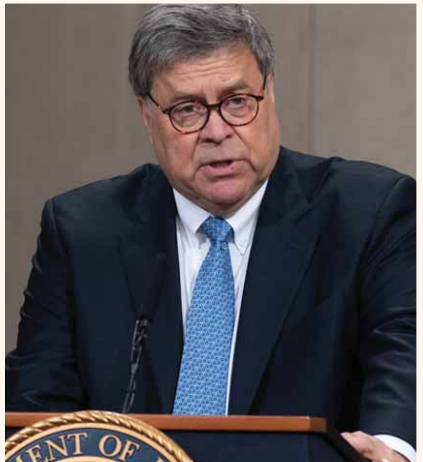
חארת: ישראל לביא

"בעיר ניו יורק בשנה האחרונה ראינו עלייה חדה בהתקפות על יהודים חרדים, במיוחד בשכונת קראון הייטס. תוקפים יהודים ברחובות ומחללים בתי כנסת", הוסיף בדאגה התובע