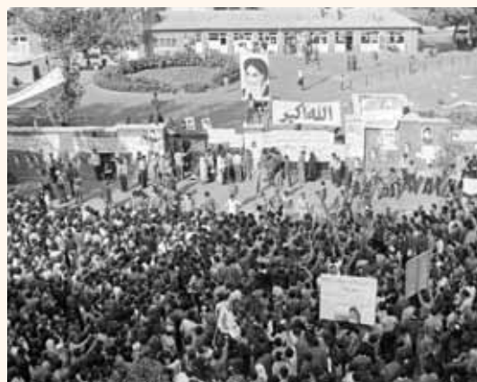
הסנקציות האמריקניות והפגיעה האיראנית במכליות נפט במפרץ.

באופן סמלי, האיש מת בתקופה מתוחה ביחסי ארה"ב-איראן