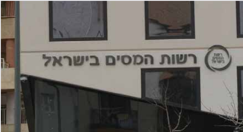
חארת: ישראל לביא

החל מ- 1.9.2019, מייצגים מקושרים לשע"מ יוכלו לצרף את לקוחותיהם להסדר הסולר רק באמצעות היישום המקוון ובקשות ידניות לא תטופלנה