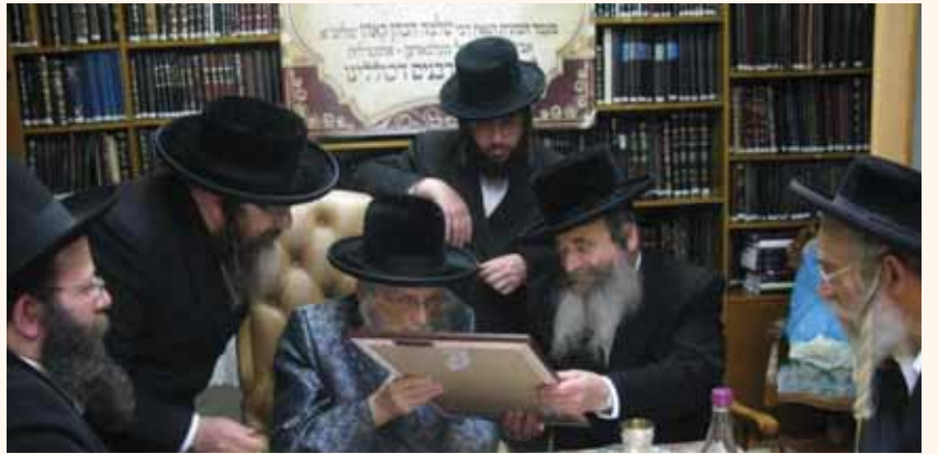
מאת: ה. שמשון

דולים שקיימו מצוה זו בהידור, ולכן כל המתעסק בצדקת רבי מאיר בעל הנס זוכה לסיוע מצד נשמות כל הני גדולים וקדושים מייסדי הקופה.