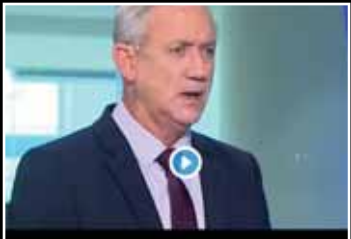
אמרנו שאנחנו בעד תחבורה בשבת

בס"ד | יום שישי ט"ז תמוז תשע"ט | 19/07/2019 | גיליון מס' 976 | ירושלים - חלה י"ז | משנה יומית: עדיות ז' ח'ט' | הלכה יומית: אלו"ח תקמ"ד-ה-א-א | דף היומי: בבלי - ערכין ל"ג